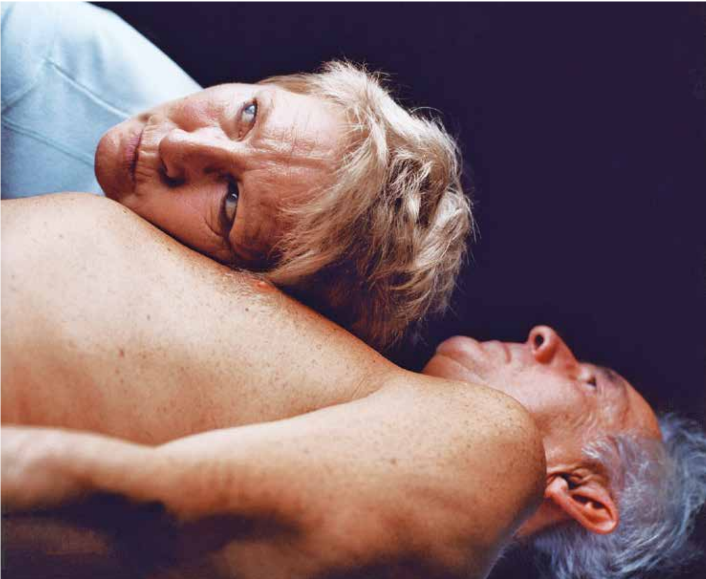
Berührung durch vertraute Menschen – auch im Alter wichtig für das Befinden

Das Hormon lässt sich jetzt künstlich herstellen: Vincent du Vigneaud synthetisiert es – und erhält, unter anderem dafür, einen Nobelpreis