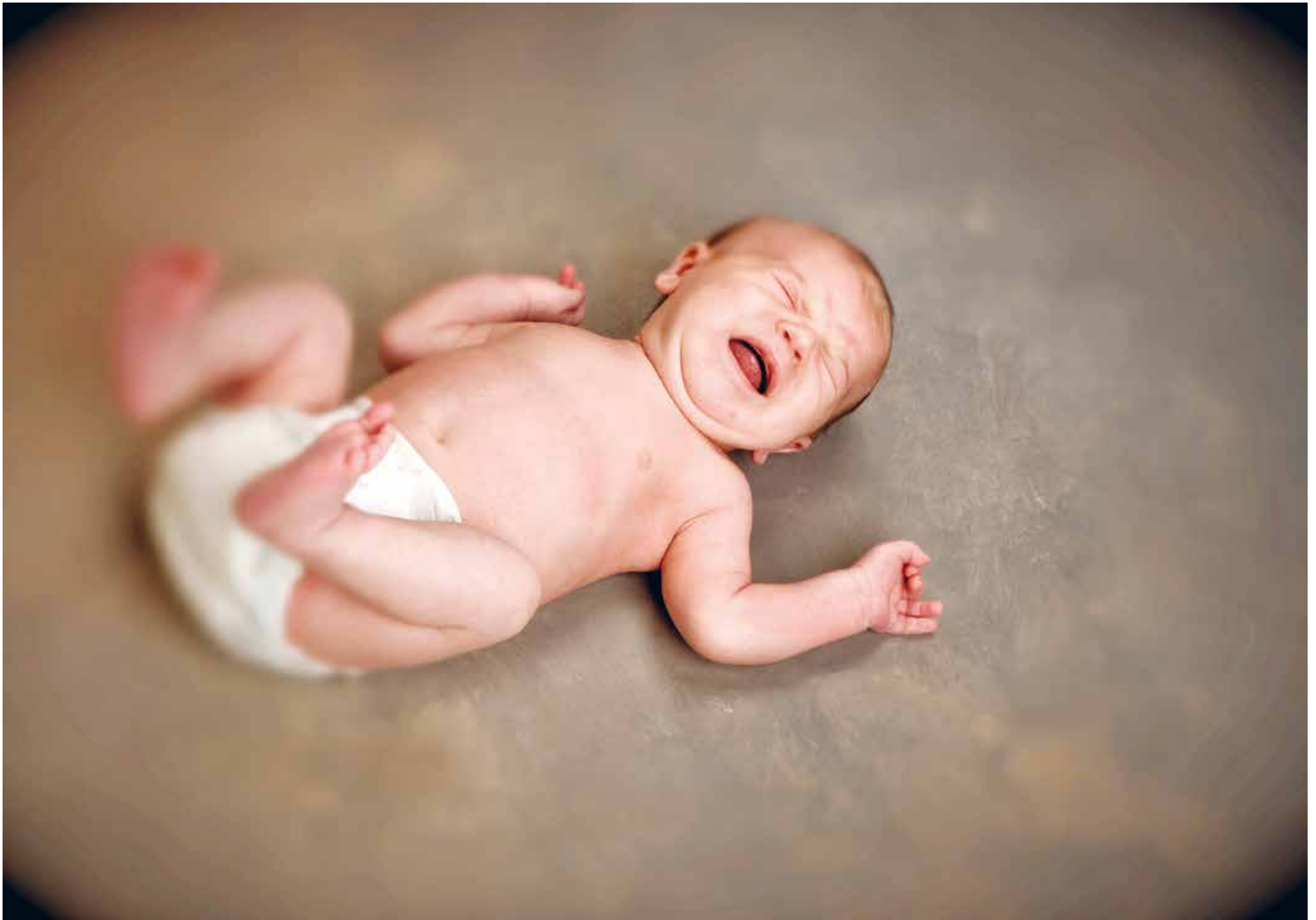
Die Zeit nach der Geburt kann entscheidend sein für das weitere Wohlbefinden eines Menschen: Das Oxytocinsystem eines Babys wird durch direkten Kontakt zur Mutter angekurbelt

NÄHE Millionen Menschen verweigern sich Berührungen. Bei vielen ist die Produktion des Hormons Oxytocin gestört. Befördern Fernbeziehungen, Wunschkaiserschnitte und 70-Stunden-Wochen diesen Mangel?