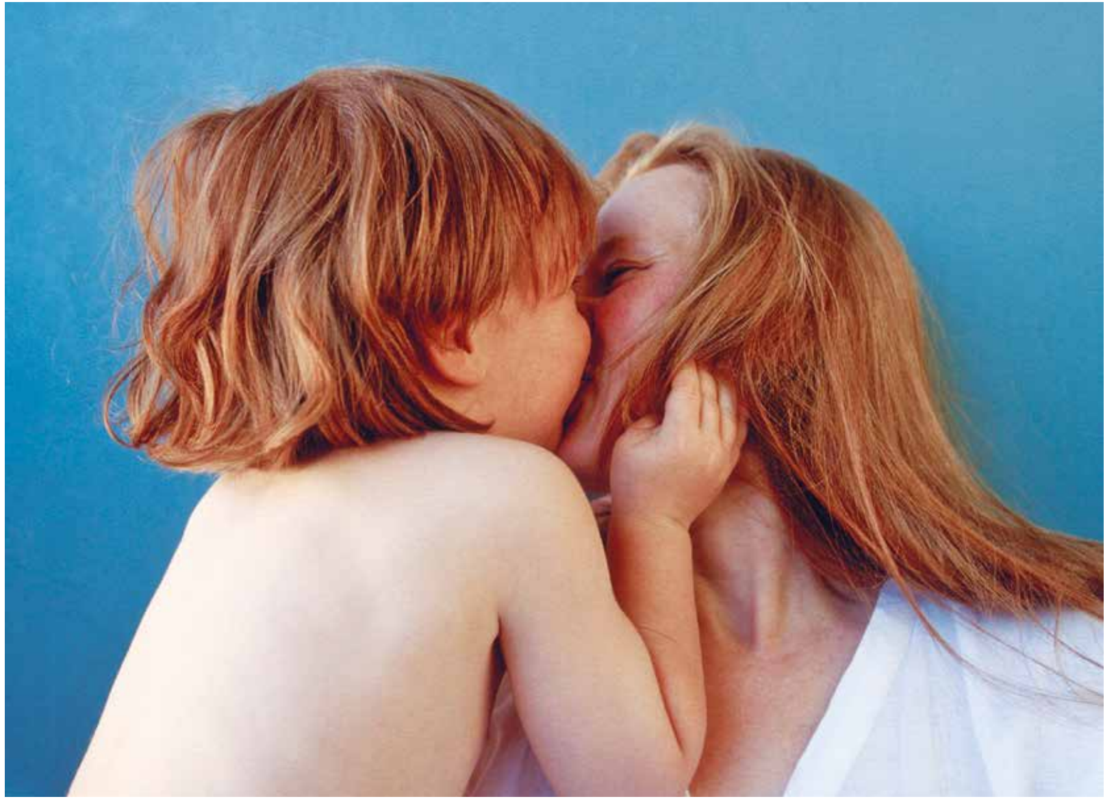
Kuss! Mutter und Kind zeigen beziehungsgerechtes Verhalten

einer Gesellschaft, in der selbst verbindende und eigentlich unplanbare Erlebnisse wie eine Geburt vorab im Kalender stehen. Geht ein für viele erstrebenswerter Lebensstil womöglich auf Kosten biochemischer Prozesse?